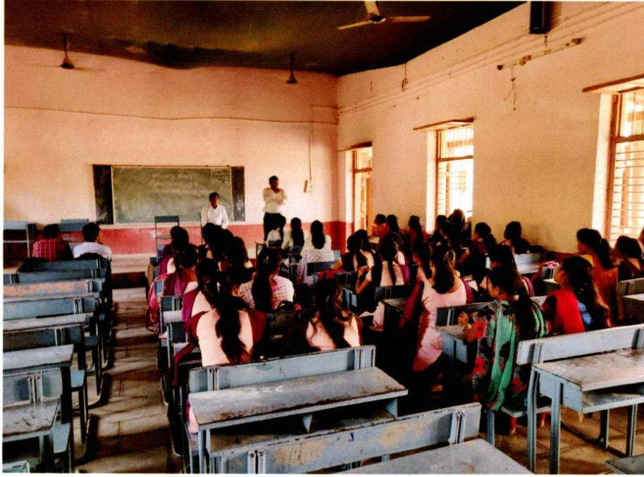
Students Participated in the PWD Voters Assistance Training Program