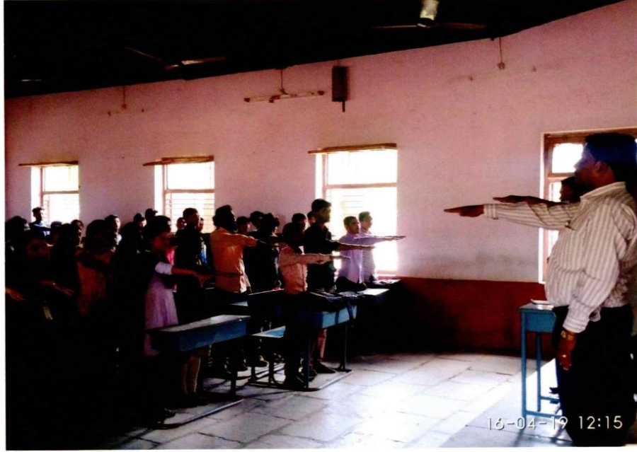
Students Taking oath of Assistance to PWD Voters and Voting Awareness Dt. 16/04/2019