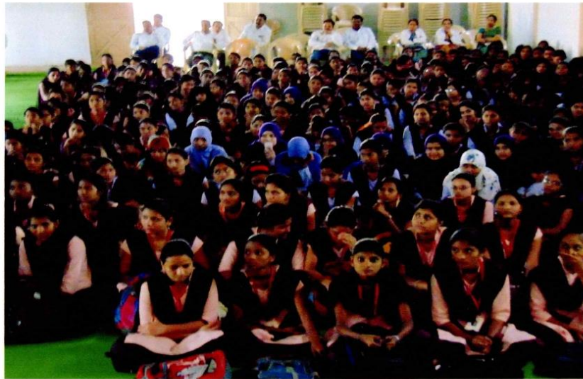
ATTENDED STUDENTS OF CONSTITUTION DAY