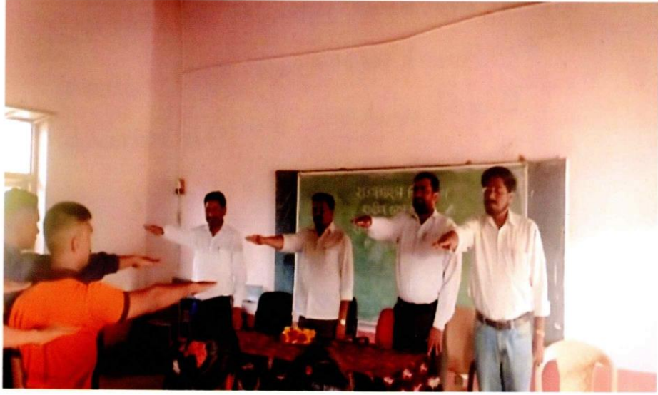
Taking Oath of Voter in The National Voter Day Programme. (Dt. 25/01/2019)