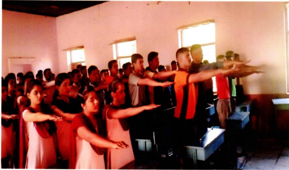
Students Taking Oath of Voter in The National Voter Day Programme. (Dt. 25/01/2019)