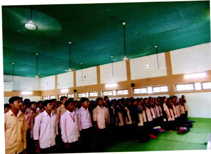
ATTENDED STUDENTS OF CONSTITUTION DAY